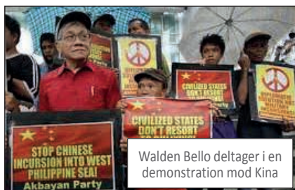
Walden Bello deltager i en demonstration mod Kina