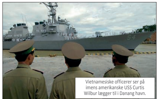
Vietnamesiske officerer ser på imens amerikanske USS Curtis Wilbur lægger til i Danang havn.

På trods af deres tøven med at give Filippinernes retssag deres fulde offentlige opbakning, har initiativet vakt udbredt beundring i officielle kredse i Vietnam, bl.a. har en pensioneret ambassadør kaldt det "heroisk". En væsentlig årsag til at initiativet er så populært er, at det har sat Beijing skakmat og forstyrret Kinas omhyggelige planlægning. Ifølge en ekspert i kinesisk diplomati "er grunden til, at de er vrede, at de allerede har fem slagmarker - på det politiske og diplomatiske område, massemedierne, sikkerhedsmæssigt, mi-