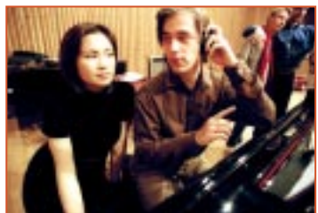
Thanh Lam og Niels Lan Doky