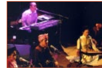
Fra »Road to Infinity« showet