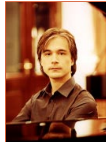
Niels Lan Doky