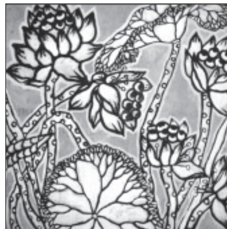
Lotus 1 (udsnit)